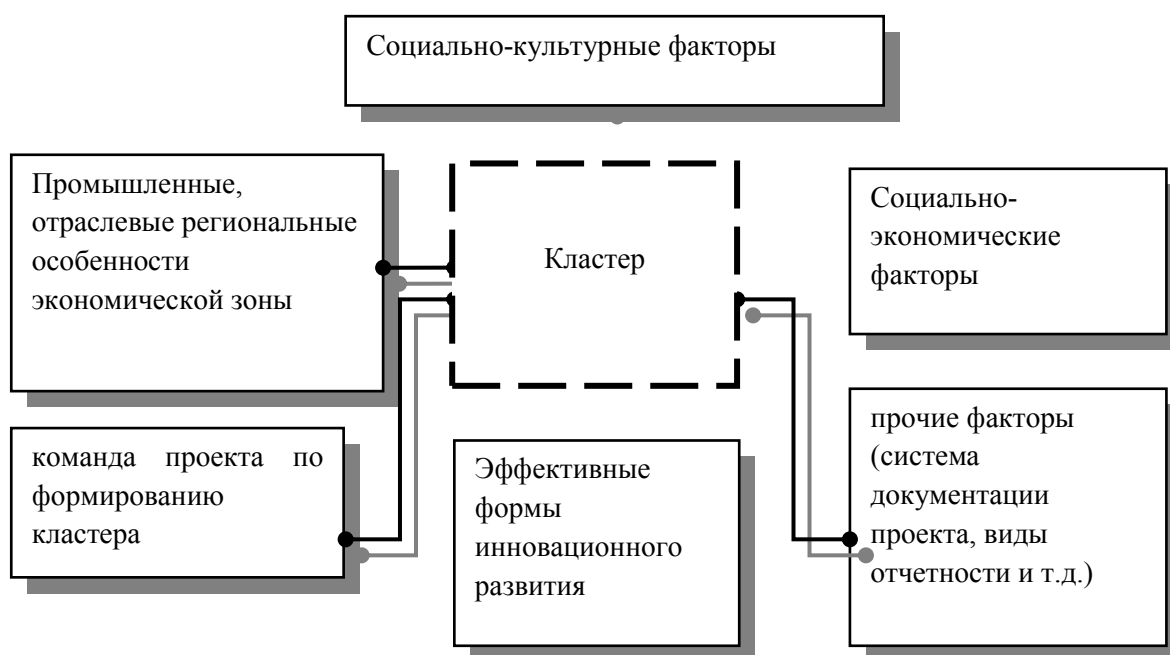
Рисунок 3. Кластер и его внутренняя среда

Для успешной организации работы кластера огромное значение имеет его внутренняя среда. На рисунке 3 отражены ее наиболее существенные факторы.