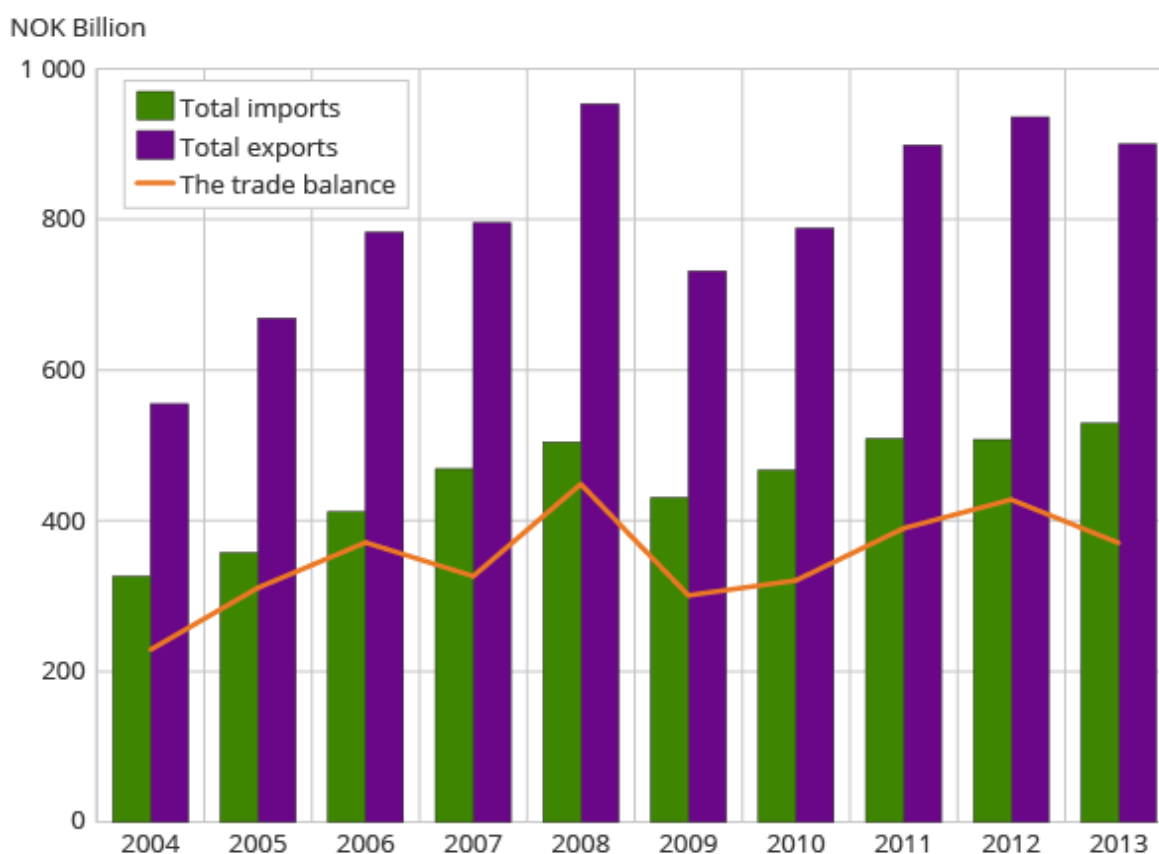
Рисунок 1- Торговый баланс Норвегии за 2004-2013гг. млн. норвежских крон

Снижение сальдо торгового баланса в 2013 году объясняется увеличением импорта на 4,3%, при одновременном снижении экспорта на 3,8%. В 2013 году экспорт на материк вырос на 1,2 % по сравнению с предыдущим годом. Ниже доходы от шельфовых товаров, сырой нефти и природного газа.